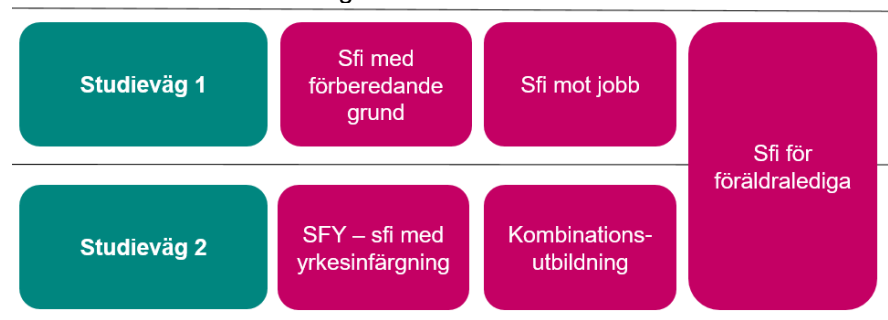
Bild 1. Sfi för olika studievägar

I Stockholm erbjuds undervisning i sfi på dagtid (förmiddag eller eftermiddag) mellan 15-18 timmar per vecka och kvällstid fem timmar uppdelat på två tillfällen. Det finns även vissa kurser på lördagar. Det finns olika typer av studiegrupper, vilka beskrivs mer ingående i kapitel 5. För studieväg 1 och 2 erbjuds endast klassrumsundervisning. Fjärr- och hybridundervisning erbjuds dock i olika omfattning under coronapandemin. För studieväg 1 och 2 finns också möjlighet att läsa sfi under föräldraledigheten tillsammans med andra föräldrar.